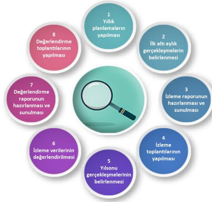
Şekil-4 İzleme ve Değerlendirme Süreci

İzleme ve değerlendirme sürecinin işleyişi ana hatları ile yukarıdaki şekilde özetlenmiştir.